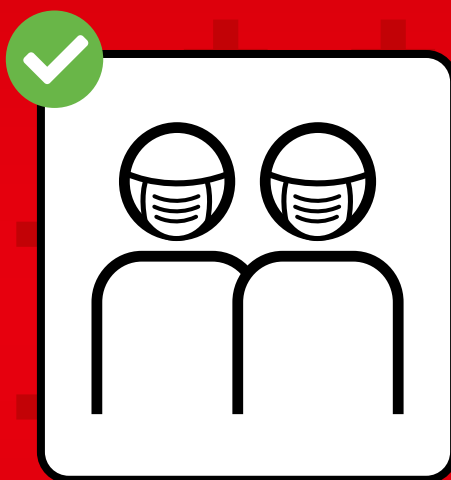
Maske tragen, wenn Abstandhalten nicht möglich ist.