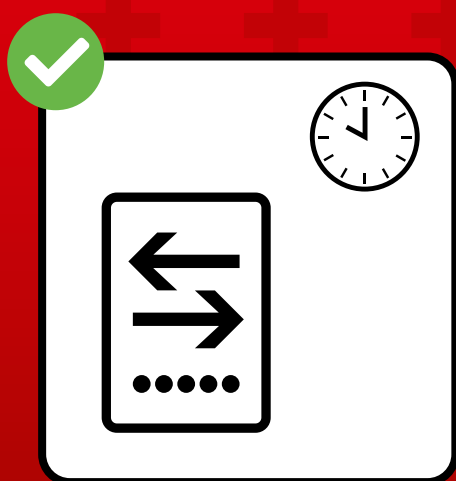
Billett online kaufen.